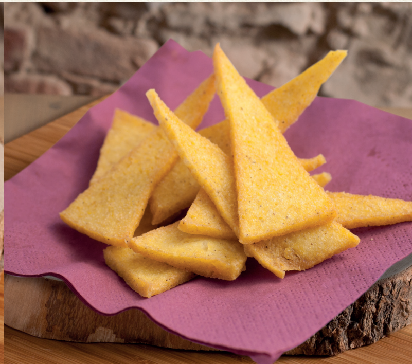
La Polenta Fritta

In caso di ALLERGIE e INTOLLERANZE si prega di informare il personale di sala prima dell'ordinazione Parma Menu vi propone ogni giorno la tradizione Emiliana. Per questo in alcuni periodi dell'anno in base alla stagionalità utilizziamo verdure surgelate di alta qualità.