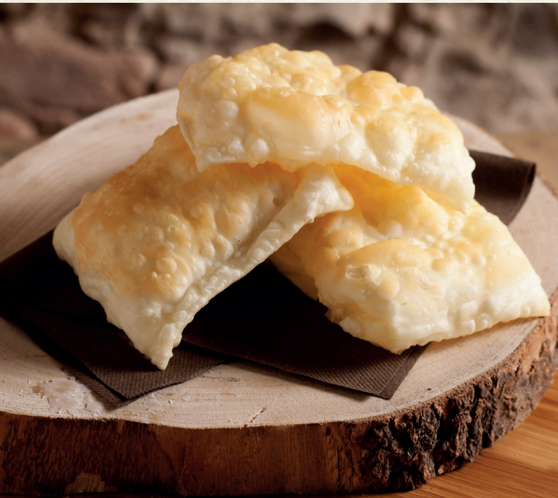
Lo Gnocco Fritto